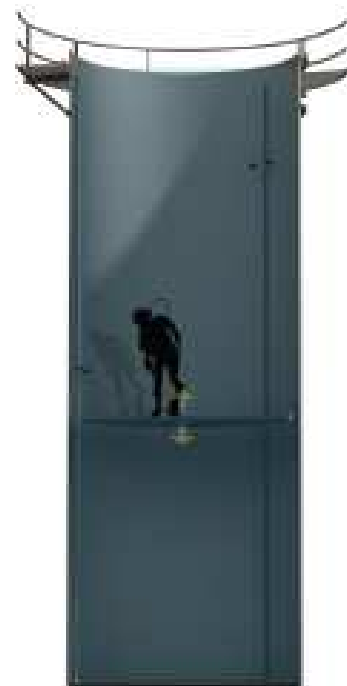
Beweegbare bodem traploos: verstelbaar in diepte