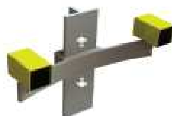
Meebewegende camera's t.b.v. beoordeling verrichtingen door instructeur en medecursisten